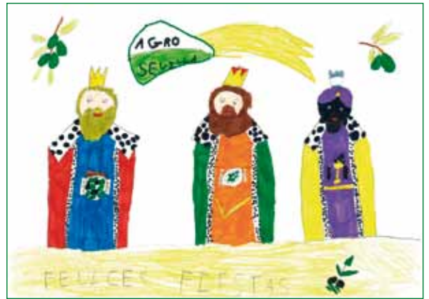
Christmas ganador Agro Sevilla 2018. Autora: Lola Borrego Montero, 6 años.